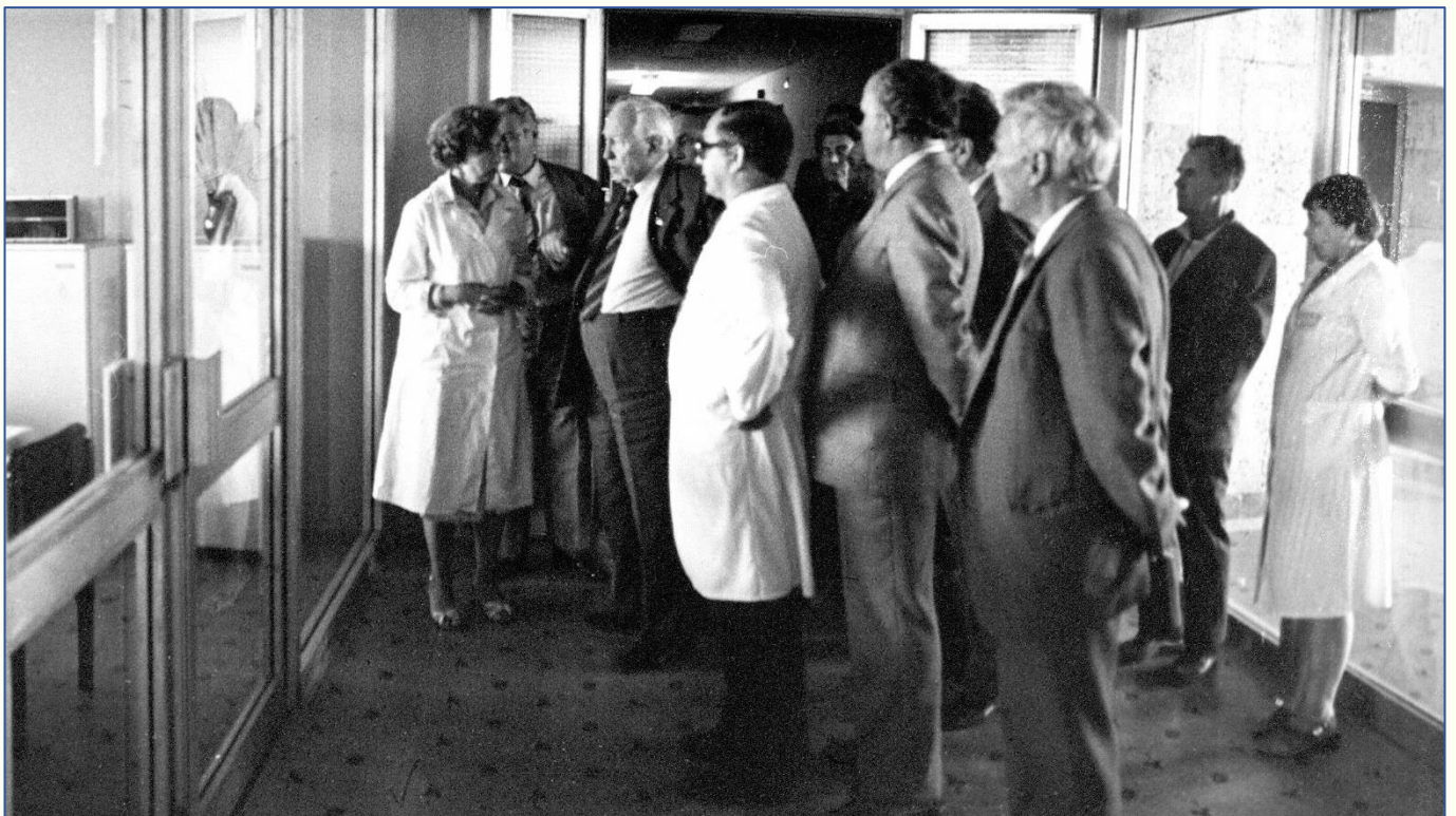
Посещение министром Славским Е.П. строящегося больничного комплекса специализированной помощи при клинической больнице № 6 Минздрава СССР в Орехово-Борисово. (Москва, 1985 г.).