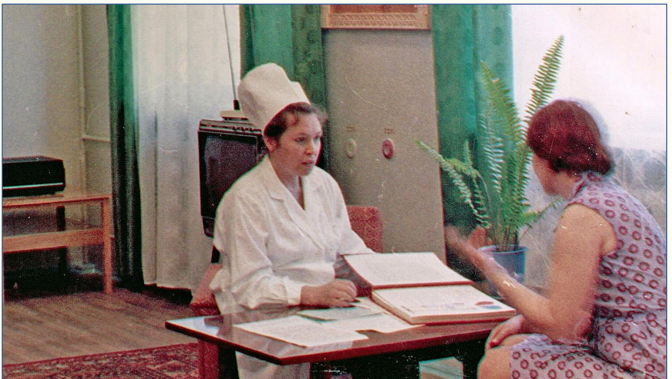
Кабинет психопрофилактики при поликлинике медсанчасти. Электрохимический завод. (г. Красноярск-45. 1977 г.). ЧУ «Центратомархив. Ф. 55. Оп. 1фд. Д. 32. Л. 52.