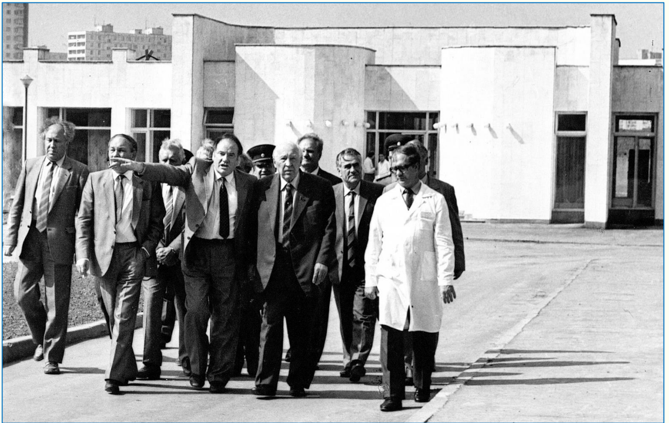
Посещение министром Славским Е.П. строящегося больничного комплекса специализированной помощи при клинической больнице № 6 в Орехово-Борисово. (Москва, 1985 г.). ЧУ «Центратомархив. Ф. 55. Оп. 1фд. Д. 112. Л. 5.