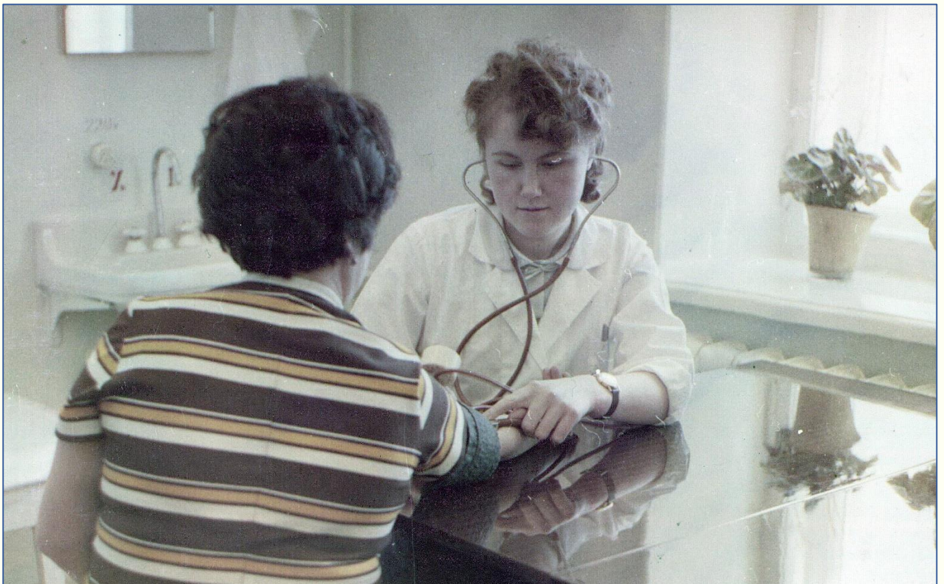
На приеме у цехового врача медсанчасти. Электрохимический завод (г. Красноярск-45. 1977 г.).