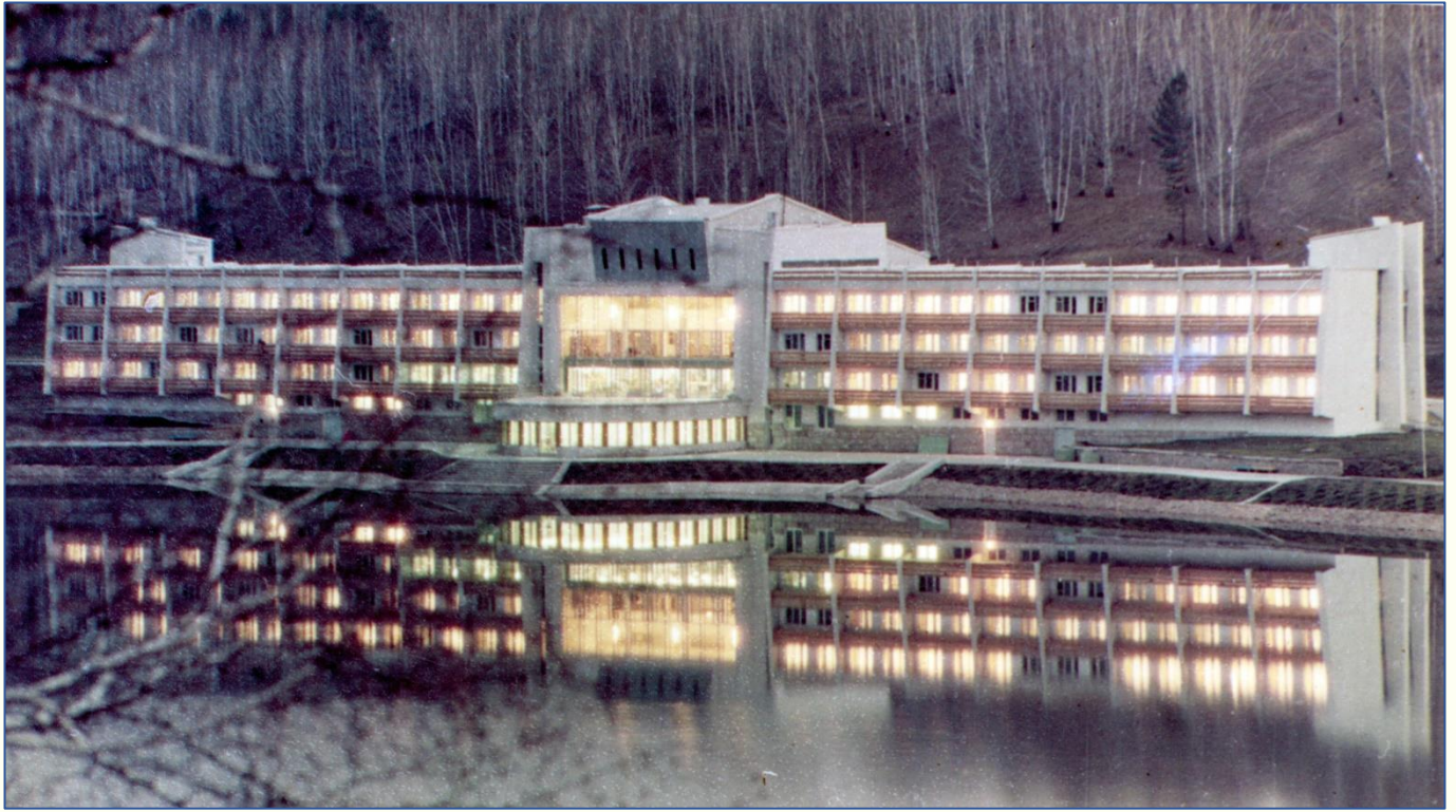
База отдыха «Березка» при Электрохимическом заводе. (г. Красноярск-45. 1977 г.).