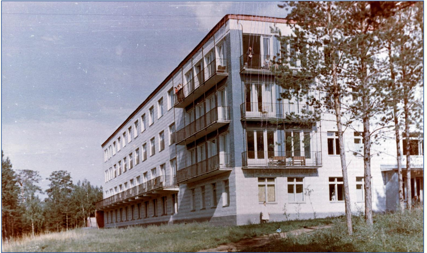
Больничный городок медсанчасти (г. Красноярск-45. 1977 г.). ЧУ «Центратомархив. Ф. 55. Оп. 1 фд. Д. 33. Л. 30.